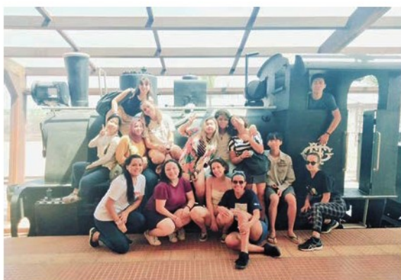
在 Goiania 火車站內留影

在學校生活方面，第一天上學的時候，同學們用簡單的肢體語言與我交流，更熱情地歡迎我。我經過一番努力學習葡萄牙語及同學的協助，最終能互相溝通，相處融洽。大家閒時會一起外出遊樂，帶我感受當地文化呢！