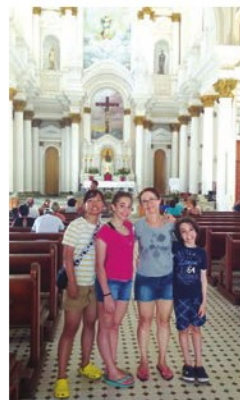
參觀 Ilheus Bahia 巴西教堂