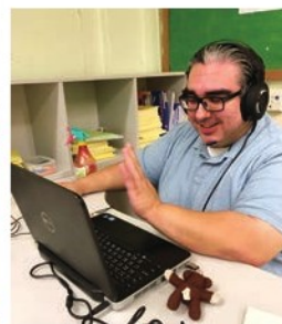
◀外籍老師與同學上網課。