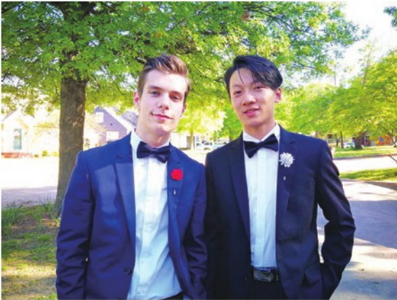
Prom night with a friend