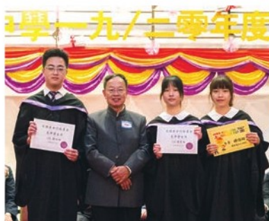
同學喜獲校外獎學金

畢業典禮於 2019 年 7 月 3 日舉行，縱然疫情未定，惟馬校監、各位校董及家教會委員仍然到場鼎力支持，一起與畢業同學分享其中的喜悅。此外，不少中六同學的家長，也抽空出席授憑和頒獎儀式，見證每位同學受憑一刻。每當上台接過畢業文憑，畢業同學也難掩內心的雀躍，臉上都綻放著燦爛笑容。典禮完結後，同學亦把握良機紛紛找老師合照，冀望能為六年的中學生涯留下最美好的回憶。雖然，無情的疫情叫同學錯過了中六最後的上課日，但在校方的努力和家長的支持下，我們最終也能將應屆畢業同學的失落化為笑靨。