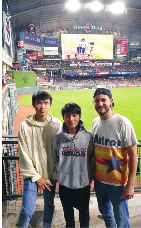
Going to watch a baseball game with friends

I have been offered a magnificent opportunity that I could never imagine several years ago. Ever since I was granted that scholarship, a sense of duty was born upon me, that I have to be a better person. Therefore I started reading. Under a less exam-oriented learning environment, I read a lot of English books, mostly literature, for example, The Chronicles of Narnia, The Count of Monte Cristo, etc. I exposed myself to this culture to learn English.