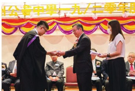
同學接過馬校監授予畢業證書