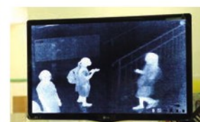
▲學校已裝置紅外線探測器，更快更有效探測體溫。