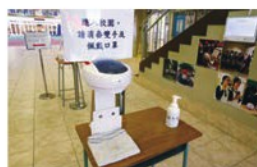
◀同學回校先消毒雙手