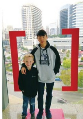
Museum visit with host's grandson in Houston

The second thing I find the most essential to the improvement of my English is taking the course of Statistics. I understand how this could have sounded bizarre to you. However, it was not until I took Statistics and read the textbook thoroughly had I found myself more comprehensible to written English.