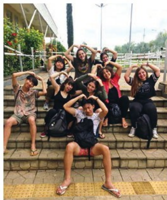
與當地同學外出遊玩