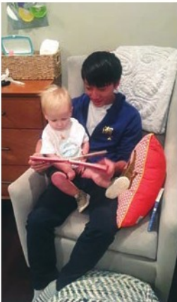
Reading a story book with a baby