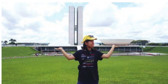
巴西國民代表大會——領導層 (Congresso Nacional Brasileiro - Lideranca do)